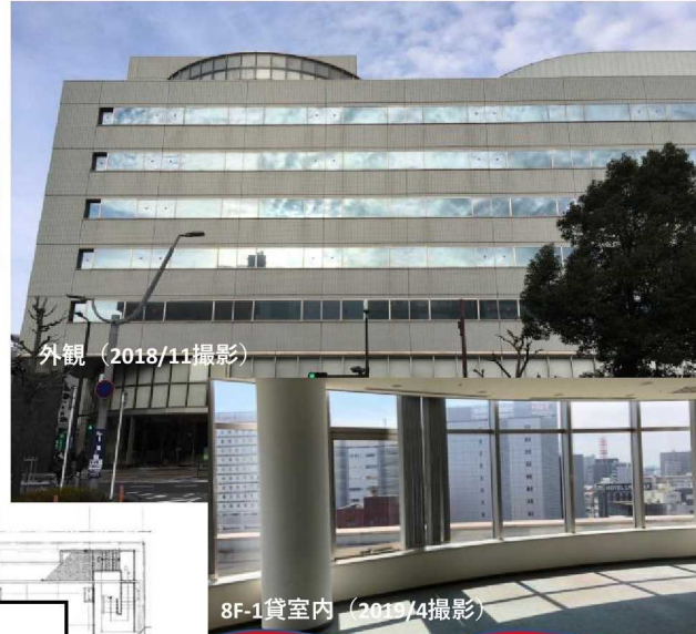
< 8階平面図 >