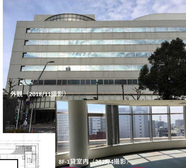
< 8階平面図 >